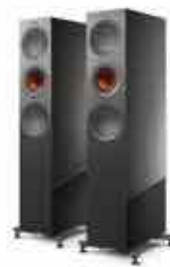
Titanium Gloss Special Edition (Exklusiv für R7 Meta)