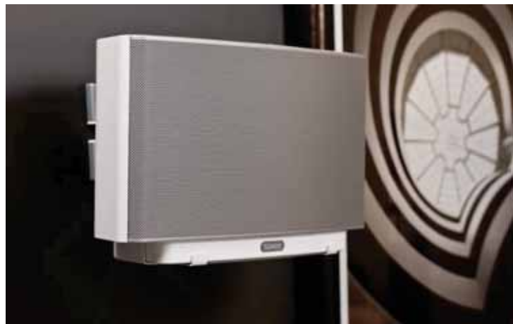
Wandhalter für PLAY:5