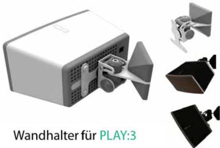
Wandhalter für PLAY:3

Die Flexson-Wandhalter sind ideal, um freien Platz im Bücherregal oder auf dem Sideboard zu schaffen. Durch die Wandmontage wird der Eingriff in den Lebensraum minimiert.